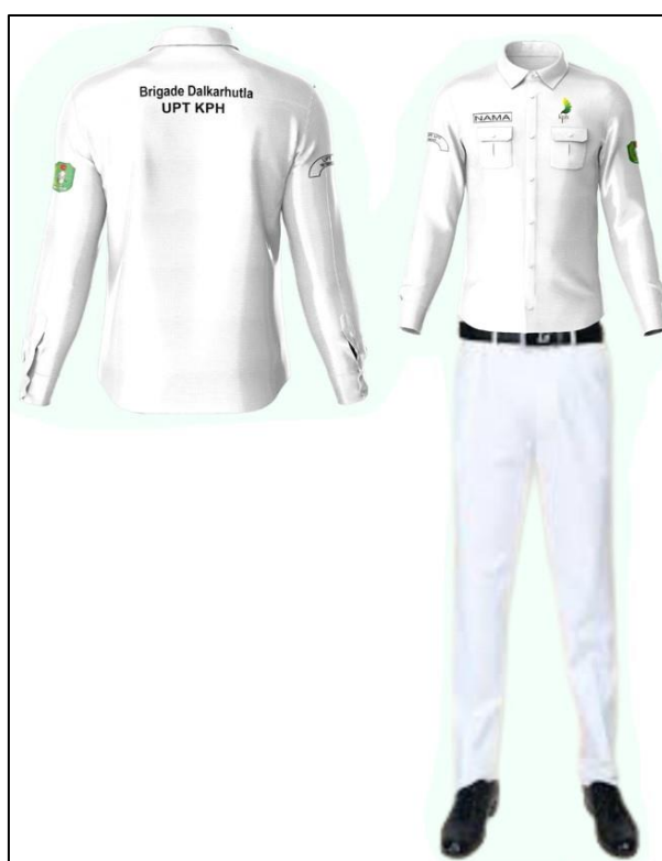
Gambar 1. Baju dan Celana Dinas Harian