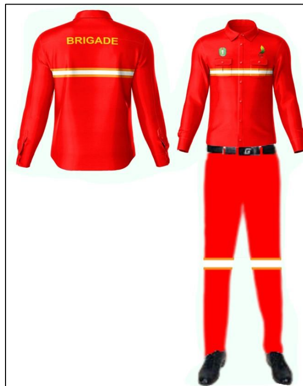
Gambar 3. Pakaian Pemadam Kebakaran