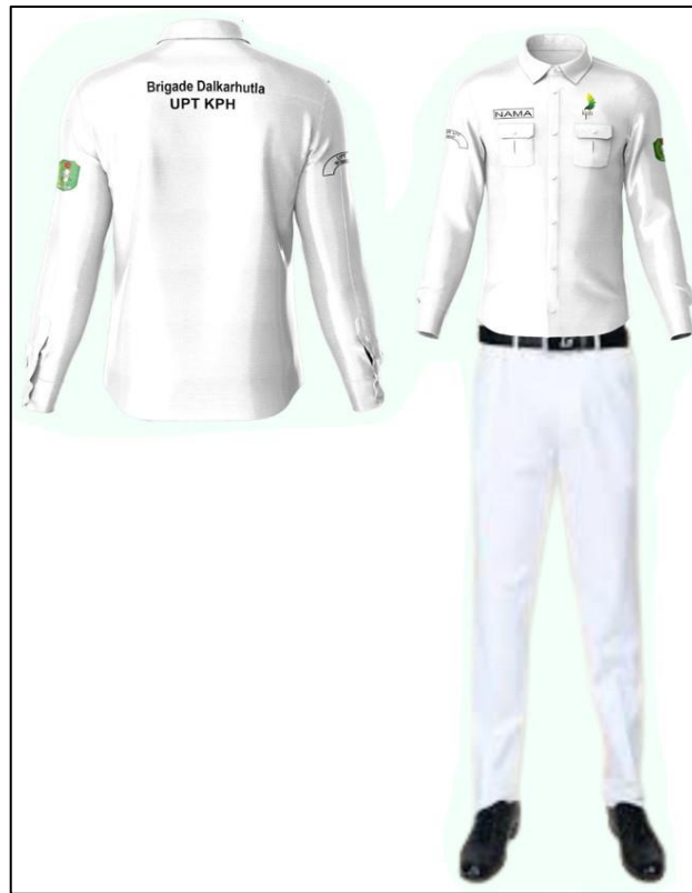
Gambar 2. Pakaian Dinas Lapangan