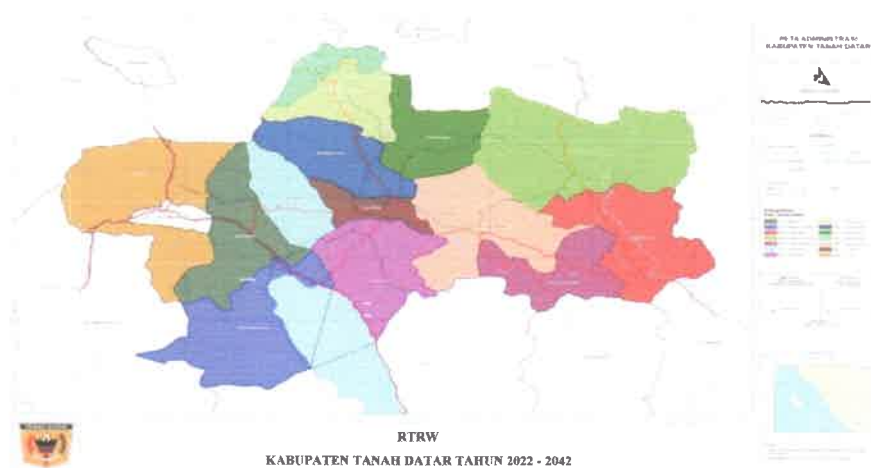
Gambar 2. 1. Peta Administrasi Kabupaten Tanah Datar