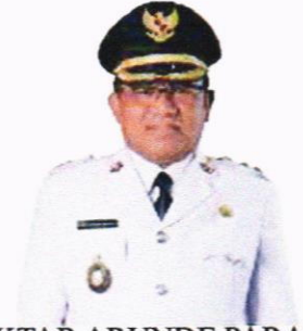
MOKTAR ARUNDE PARAPAGA WAKIL BUPATI KEPULAUAN TALAUD