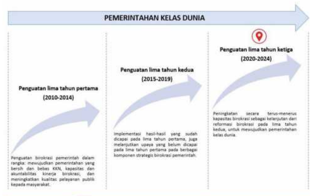
Gambar 1. Grand Design Reformasi Birokrasi

Saat ini pelaksanaan reformasi birokrasi memasuki periode ketiga dari Grand Design Reformasi Birokrasi tahun 2010-2025 yaitu tahun 2020-2024. Pada periode ketiga ini reformasi birokrasi diharapkan menghasilkan karakter birokrasi yang berkelas dunia ( world class bureaucracy ) yang dicirikan dengan beberapa hal, yaitu pelayanan publik yang semakin berkualitas dan tata kelola yang semakin efektif dan efisien.