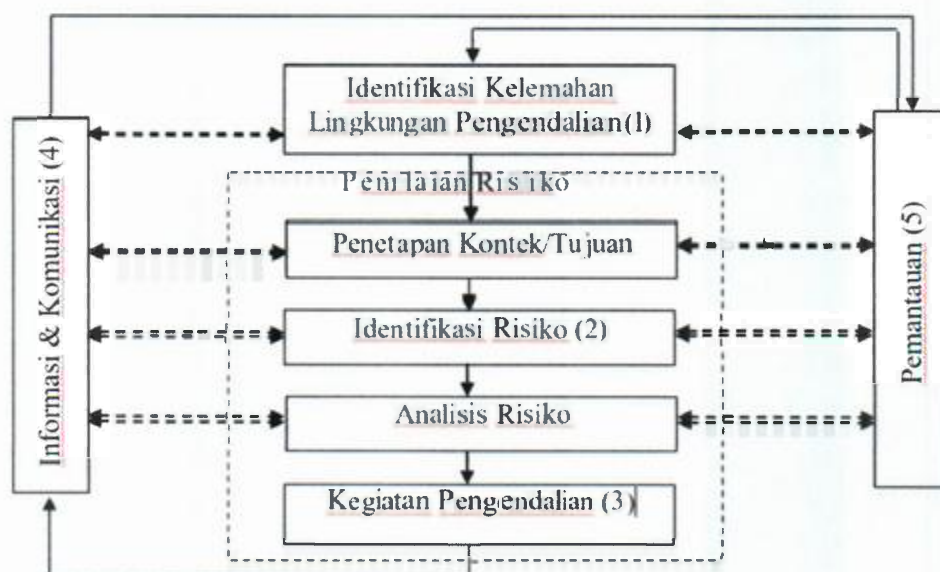
Alur 1.1 Proses Pengelolaan Risiko

Pengelolaan Risiko dilakukan oleh seluruh jajaran manajemen dan segenap pegawai di Lingkungan Pemerintah Kabupaten Lombok Barat dengan tahapan sebagai berikut: