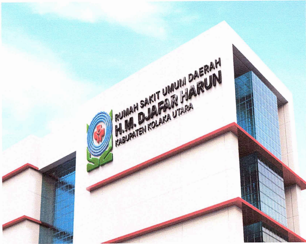
Bangunan Rumah Sakit