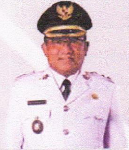
MOKTAR ARUNDE PARAPAGA WAKIL BUPATI KEPULAUAN TALAUD