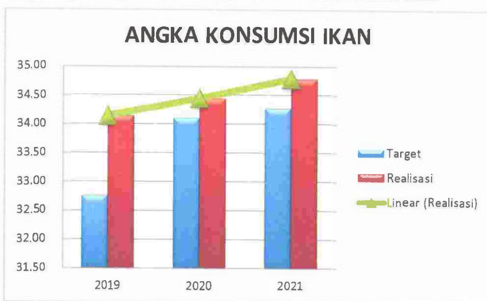
Gambar 2.3.2 Trend Angka Konsumsi Ikan 2019-2021 berdasarkan Renstra 2019-2024

Gambar diatas menunjukkan bahwa realisasi capaian kinerja tahun 2019 sebesar 34,14 Kg/Kapita/Org atau sebesar 97,54% dengan capaian Indikator Kinerja sebesar 104,21% dimana angka realisasi tersebut melebihi Target RPJMD Tahun 2019 yakni sebesar 33,90Kg/Kapita/Org atau sebesar 96,86%. Selanjutnya capaian kinerja Tingkat Konsumsi Ikan masyarakat pada tahun 2020 sebesar 34,44 Kg/Kapita/Org atau sebesar 98,40% dengan capaian Indikator Kinerja sebesar 101% dimana angka realisasi tersebut melebihi Target RPJMD Tahun 2020 yakni sebesar 34,10Kg/Kapita/Org atau sebesar 97,43%. Pada tahun 2021 capaian kinerja sebesar 34,78 Kg/Kapita/Org atau sebesar 99,37% dengan capaian Indikator Kinerja sebesar 101,49% dimana angka realisasi tersebut melebihi Target RPJMD Tahun 2020 yakni sebesar 34,27 Kg/Kapita/Org atau sebesar 97,91%. Angka Konsumsi Ikan Kabupaten Ende pada tahun 2019, 2020 dan 2021 terus menerus mengalami peningkatan. Hal ini dikarenakan masyarakat sudah mulai memahami tentang manfaat dan pentingnya mengkonsumsi ikan. Dalam meningkatkan konsumsi ikan perlu tersedianya infrastuktur yang sangat penting dalam menciptakan rantai