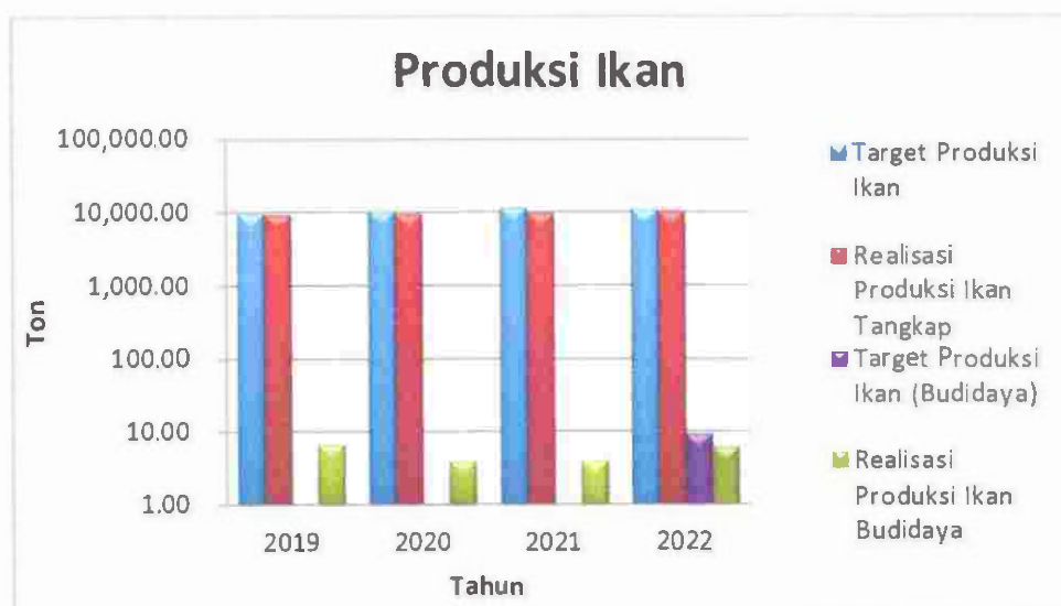
Gambar 2.3.1 Trend Produksi perikanan 2019-2022