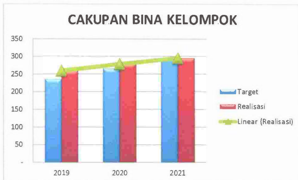
Gambar 2.3.4 Grafik Trend Cakupan Bina Kelompok berdasarkan Renstra 2019-2024