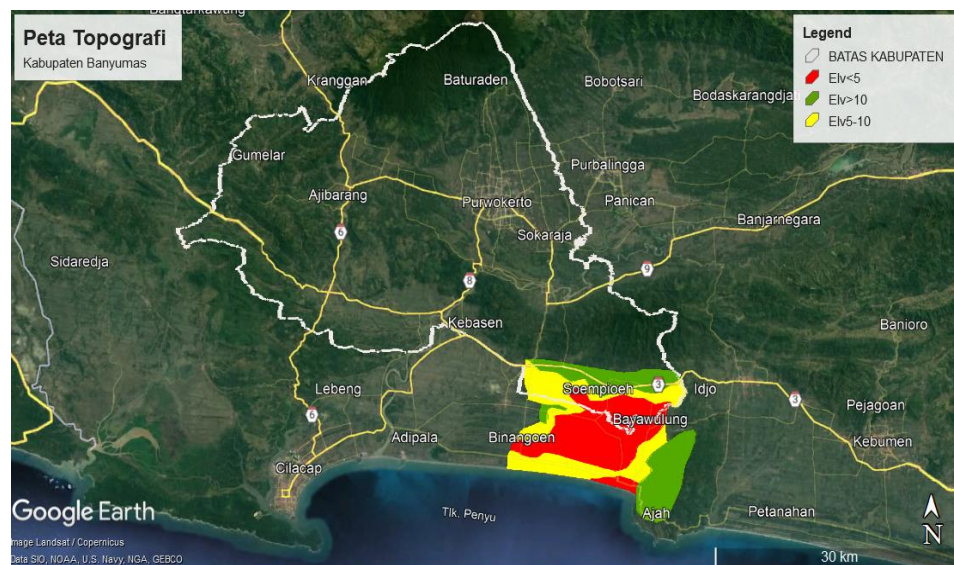
Gambar 2 Elevasi terendah di Kecamatan Kemranjen, Tambak dan Sumpiuh

Adanya kondisi topografi unik di 3 kecamatan tersebut menjadikan kondisi banjir semakin berpeluang besar. Masyarakat sekitar menyebutkan area mereka sebagai cekungan atau mangkok. Terlihat pada peta topografi di bawah area dengan zona atau warna merah (elevasi -1 sampai dengan 5) secara keseluruhan berkisar 10.098 Ha. Zona merah yang masuk Kabupaten Banyumas sekitar 2.874 Ha. Dalam peta juga terlihat jalan nasional memiliki elevasi lebih dari 10, artinya banjir yang mengancam berada di area atau zona berwarna kuning dan merah.