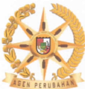
Gambar Lencana Agen Perubahan