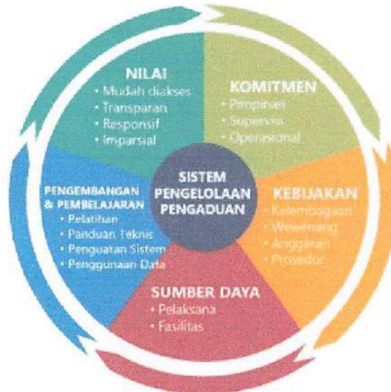
Gambar 1. Kerangka Kerja Sistem Pengelolaan Pengaduan

Kerangka kerja pengelolaan pengaduan yang efektif harus didukung oleh komponen-komponen: nilai, komitmen, kebijakan, sumber daya, pengembangan, dan pembelajaran.