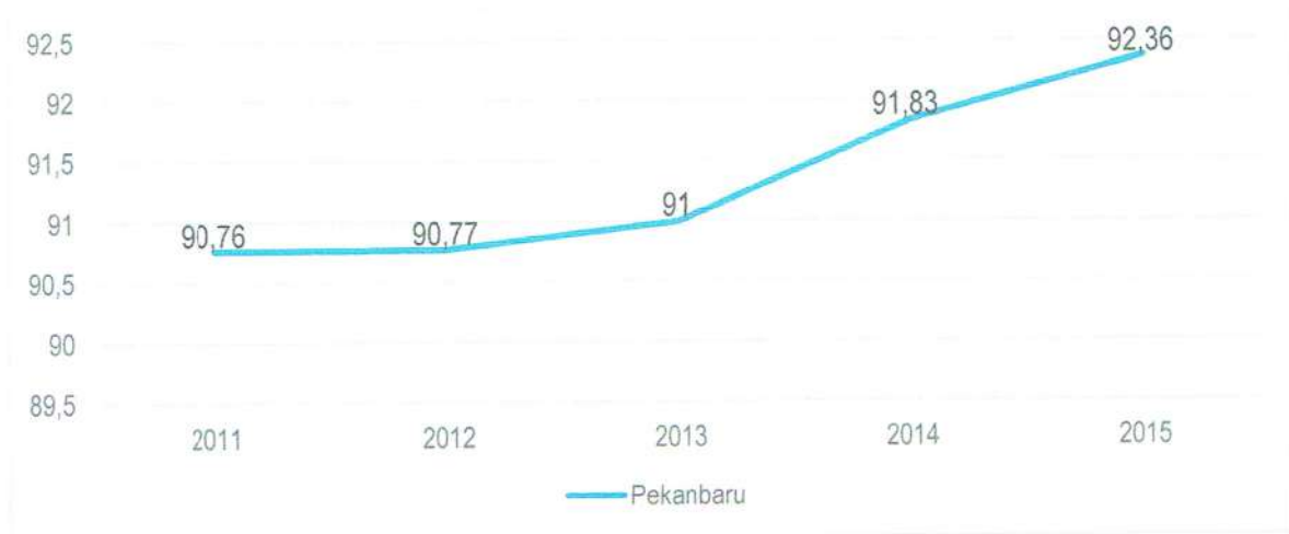
Grafik 2 IPG Kota Pekanbaru Tahun 2011 – 2015

Dari grafik 2 dapat dilihat bahwa IPG Kota Pekanbaru mengalami kenaikan setiap tahun dengan rata-rata kenaikan 0,4 poin setiap tahun. Hal ini menggambarkan bahwa kualitas perempuan di Kota Pekanbaru dari setiap tahun sudah semakin baik.