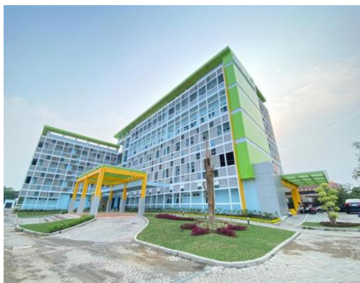
Gambar 2.1 Gedung RSUD Gresik Sehati Kabupaten Gresik

Lokasi RSUD Gresik Sehati terletak di belahan Selatan Kabupaten Gresik dan dengan merupakan daerah perifer dekat dengan Kecamatan Dawar Blandong Kabupaten Mojokerto, Daerah tersebut merupakan daerah yang cukup berkembang. Lokasi tersebut mudah dicapai karena RSUD Gresik Sehati terletak Jalan Raya Slem pit Kedamean sehingga memudahkan masyarakat mengakses keberadaanya khususnya masyarakat Gresik Selatan (Kec. Menganti, Kec. Wringinanom) dan Wilayah Mojokerto (Kec. Dawar Blandong)