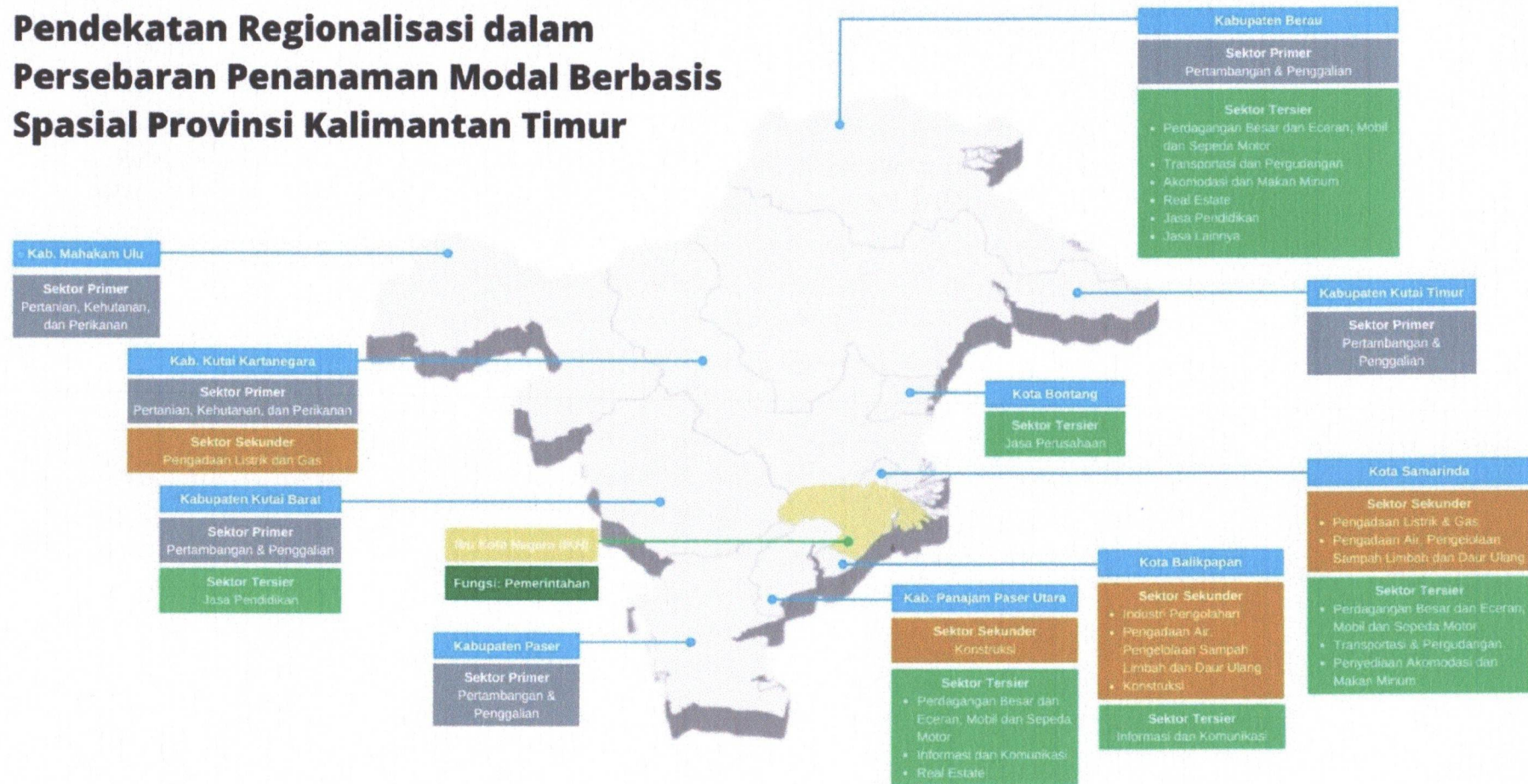
Gambar 1. Persebaran Penanaman Modal berbasis Spasial Provinsi Kalimantan Timur